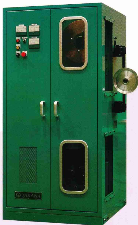
Model : PH-10K