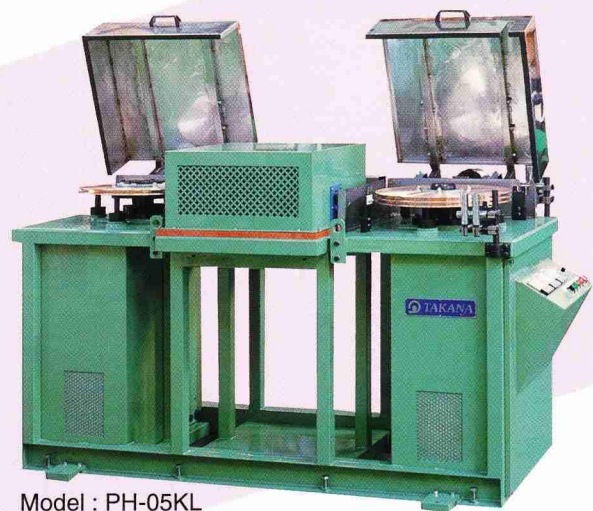
Model : PH-05KL